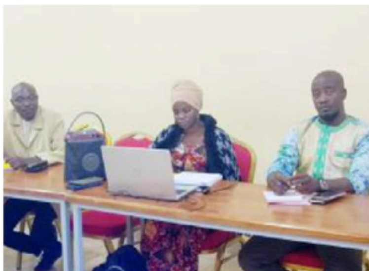
Les participants à l'atelier,