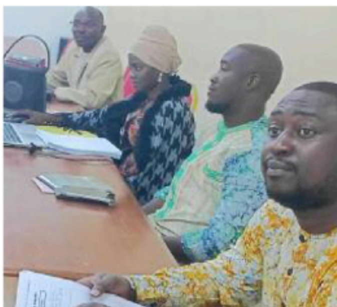
Une vue des participants à l'atelier de validation des annuaires statistiques 2023 et 2024 de la commande publique