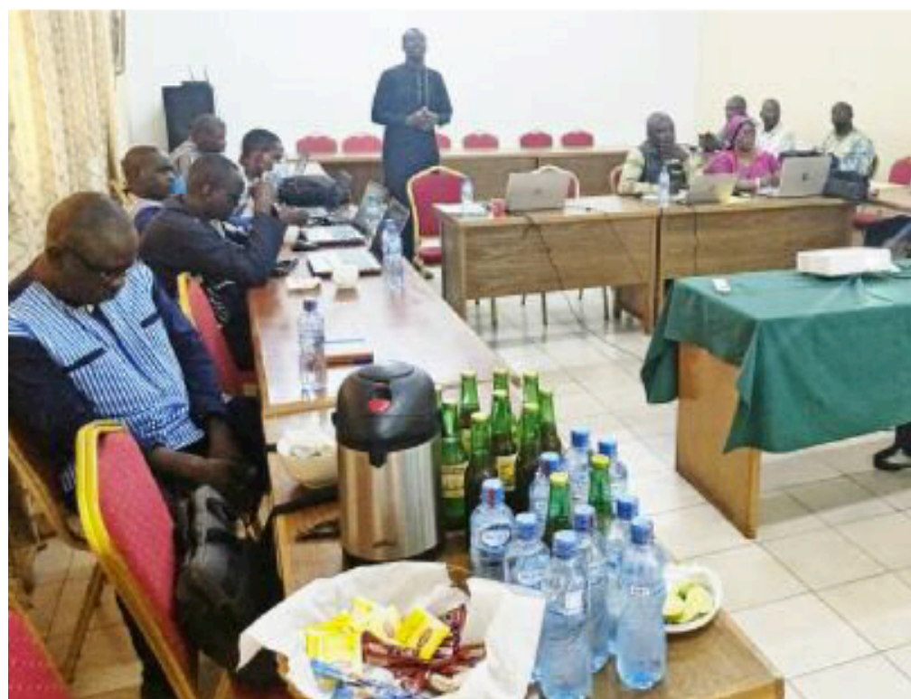
Une vue des participants à l'atelier de validation des annuaires statistiques 2023 et 2024 de la commande publique

16 décembre 2025, Salle de conférence de la résidence Alice